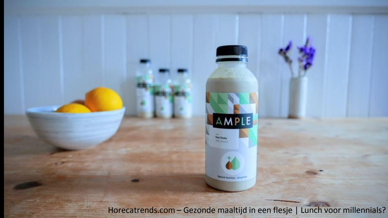
Horecatrends.com – Gezonde maaltijd in een flesje | Lunch voor millennials?

Of krijgt jouw leisure centrum straks een automaat waar je een gezonde maaltijd uit de muur trekt? Zoals bij de startup Eatsa uit Silicon Valley (begonnen in 2015 en nu al 7 vestigingen).