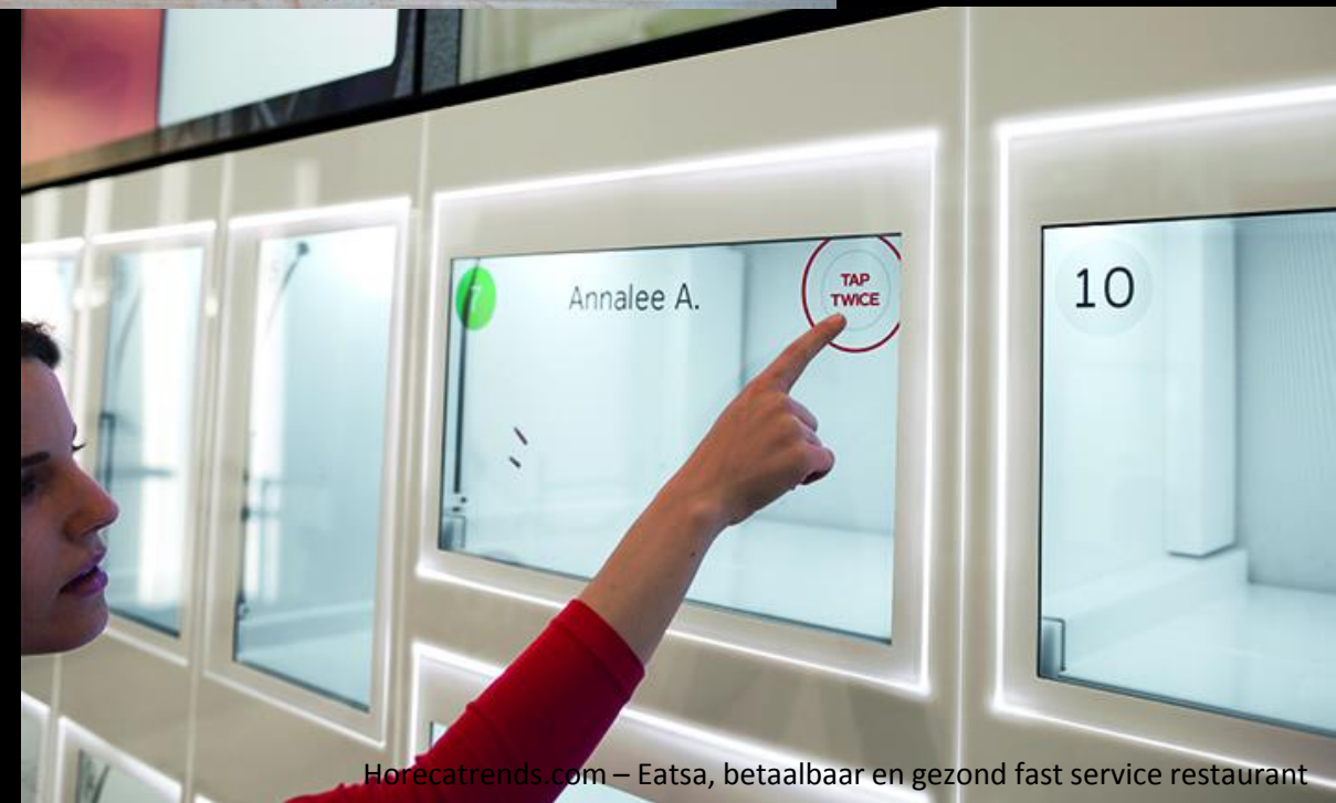
Eatsa, betaalbaar en gezond fast service restaurant