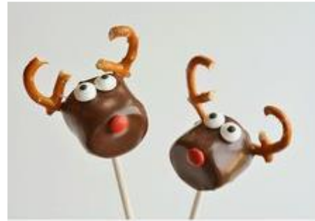
marshmallow REINDEER TREATS

Kerstkoortje lijkt ons wat over de top maar wel goed te organiseren samen met collega's in de horeca: van terras naar terras! Kijk eens op Pinterest en wie weet kom je iets tegen dat jij in jouw horecabedrijf ook kunt gebruiken.